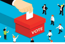
हरिभूमि न्यूज़ >>> विदिशा