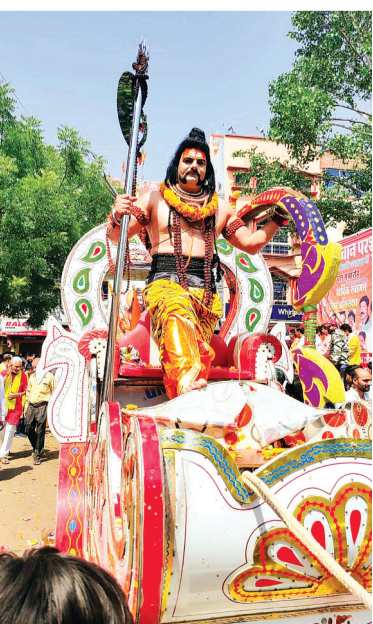
हरिभूमि न्यूज अशोकनगर

अक्षय तृतीया का दिन भगवान परशुराम की जयंती का दिन है। वह भगवान विष्णु के छठवें अवतार हैं। शुक्रवार को शहर में परशुराम जयंती का आयोजन भव्यता के साथ किया गया। जिन जिन रास्तों से शोभा यात्रा निकली, पूरे मार्ग पर भगवान परशुराम की जयजयकार होती देखी गई। समाजसेवी संस्थाएं भी स्वागत और सम्मान में आगे आईं। समारोह की भव्यता और धार्मिक आभा के बीच इस चल समारोह की शुरुआत सुबह 08 बजे स्थानीय परशुराम मंदिर से की गई। सर्व ब्राह्मण महापंचायत ट्रस्ट के तत्वाधान में यह आयोजन किया गया था। इस दौरान शोभा यात्रा से पहले भगवान परशुराम जी की भक्ति भाव से आराधना की गई। पूजन और आरती के साथ श्रद्धालुओं ने