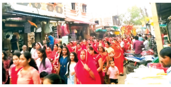
हरिभूमि न्यूज़ >>> सुठालिया

नगर में सर्व ब्राह्मण समाज द्वारा शुक्रवार को सुठालिया नगर में सर्व ब्राह्मण समाज द्वारा शुक्रवार को भगवान परशुराम की जयंती हर्षोल्लास के साथ मनाई गई समाज जनों ने भगवान परशुराम जी की नगर में जय परशुराम के जयकारों के साथ शोभायात्रा निकाली।