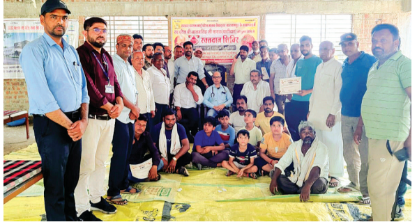
हरिभूमि न्यूज़ >>> सारंगपुर