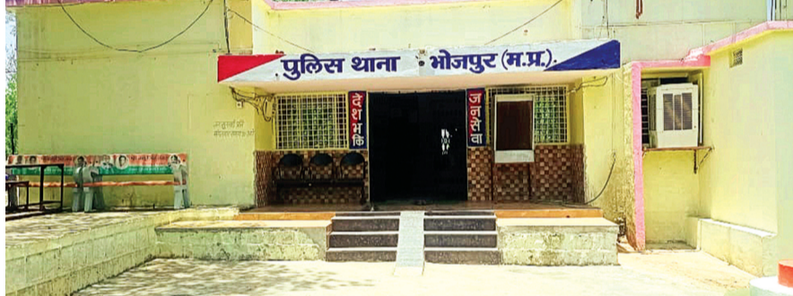
हरिभूमि न्यूज़ >>> ब्यावरा