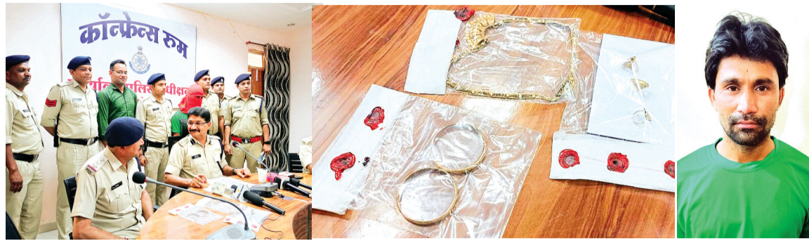
हरिभूमि न्यूज अशोकनगर

ख़ास बातें सिरोज में 20, आरोन में 18 और अशोकनगर में एक दर्जन चोरी की घटनाओं को दे चुका है अंजाम सिरोज में स्पाइडर मेन के नाम से जाना जाता है, बार्डर फिल्म में पेंट से रूपए चुराने के साथ की यह शुरुआत।